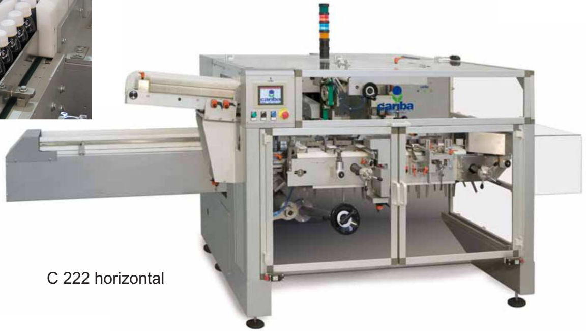
C 222 horizontal